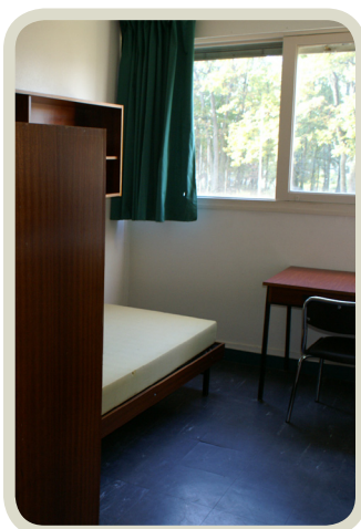
Chambre de 9m 2 Avant

La fin des travaux des résidences « Les Roses » et « Les Dahlias » vient finaliser l'objectif ambitieux de réhabiliter l'ensemble des résidences dites traditionnelles d'ici à la fin de la décennie (2010).