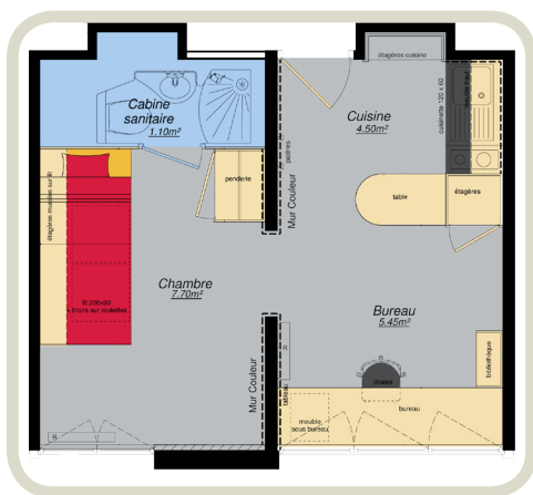
Plan d'un studio type Résidence Les Dahlias

Pour la résidence des Dahlias, les 256 chambres seront converties en 128 studios. Ainsi en doublant la surface d'habitation, le CROUS répond à la forte attente des étudiants en terme d'espace et de confort.