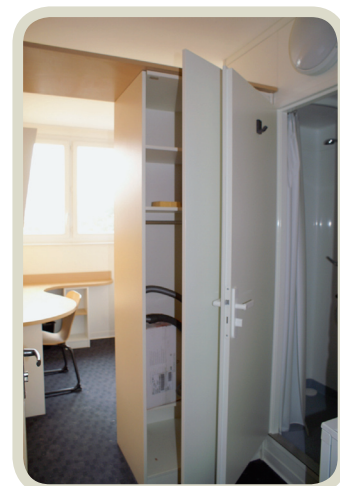
Chambre de 9m 2 avec cabine tri-fonction Après

Depuis leur construction, les bâtiments n'avaient jamais fait l'objet d'une réhabilitation complète mais ont bien sûr bénéficié de nombreuses mises en état.